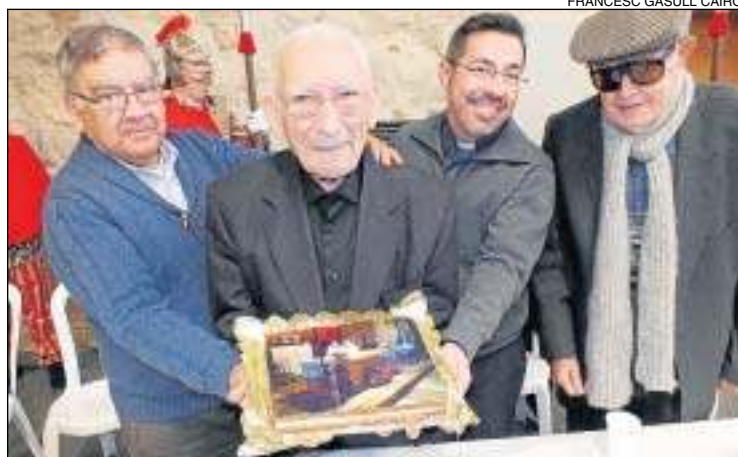
L'acte d'homenatge al Talladell el mes de març passat.