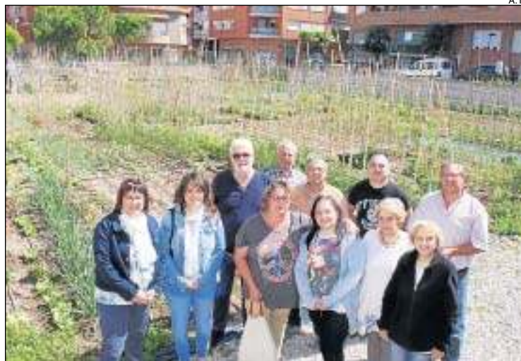
Foto de grup de les famílies i els regidors del consistori.

parròquia del Talladell, aquell any va rebre el premi Culturàlia. El 6 de març passat el Talladell també li va retre un sentit homenatge i l'any passat Tàrrega li va dedicar un llibre. Entre els seus projectes cal destacar que va ser fundador d'Alba.