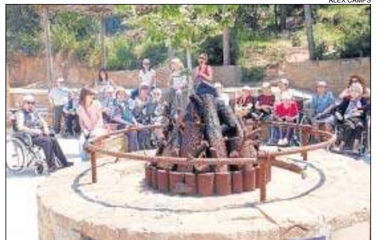
L'excursió a Tiurana.