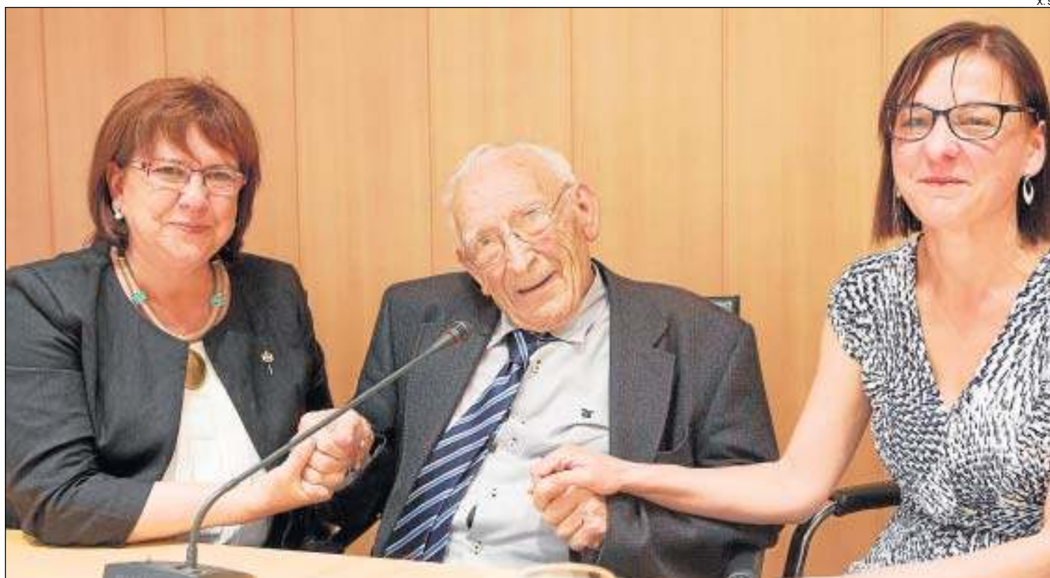
Tàrrega li va dedicar el 2015 un llibre bibliogràfic.