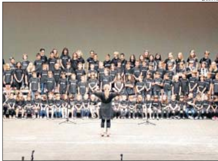
L'actuació al Gran Teatre.

Hi hagué també temps per al lliurament d'orles de la quinzena d'alumnes que han acabat enguany els estudis de grau professional i que mereixen el reconeixement per la seua dedicació i el seu esforç al llarg dels sis cursos en què es distribueix.