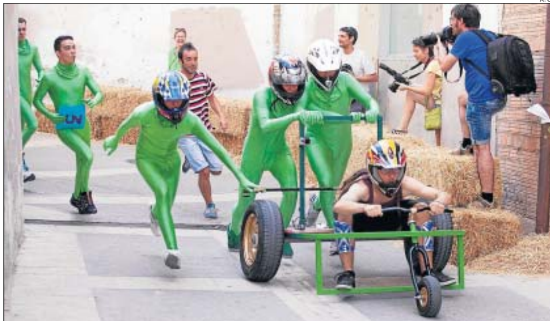
Una imatge de la Cursa d'Andròmines, una de les estrelles del Flèndit.

Un total de 42 colles participaran demà dissabte en les 21 proves de la gimcana targarina. De la festa, destaca la Cursa d'Andròmines