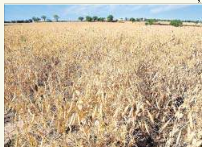
Una plantació de pèsol prop del Llor (Torrefeta i Florejacs).