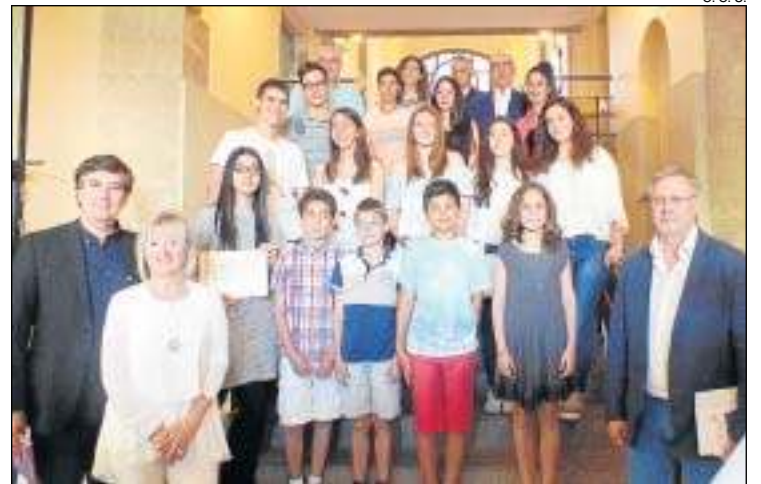
L'acte de lliurament de premis.